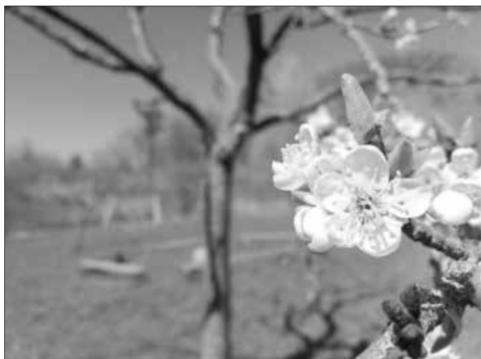
Frühlingserwachen in der Lias-Grube.