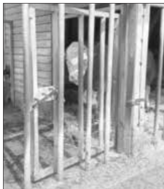
Das Torschloss wird von außen gelöst. Bauartbedingt fällt das Tor von selbst zu und perrt den Bullen im Stall ein. Der Tierbetreuer kann den Außenbereich der Bullenbucht betreten ohne Gefahr zu laufen, auf den Bullen zu treffen. Öffnet er das Tor, bewegt er sich dahinter und verlässt den Laufhof durch die Gitterstäbe.