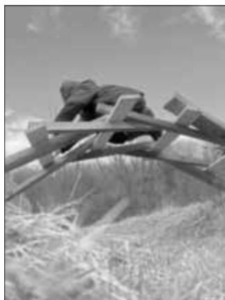
Mit der gemeinsam gebauten Leonardo-Brücke lassen sich Gräben überwinden.