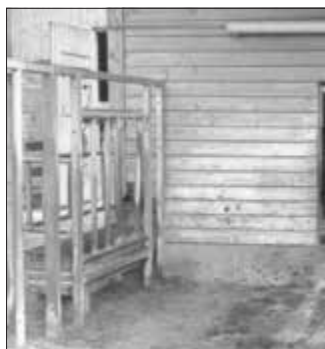
Durch das Umlegen des Hebels verengen sich die stabilen Metallstäbe am Futterplatz v-förmig und halten den Bullen fest.