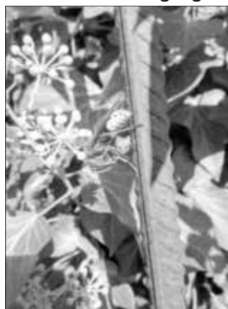
Natürliche Schädlingsbekämpfung: Hornisse mit ihrer Beute

Interessierte haben die Möglichkeit, sich zum geprüften Wespen- und Hornissenberater oder zur geprüften Wespen- und Hornissenberaterin ausbilden zu lassen. Die Teilnahme an einem entsprechenden Lehrgang wird von der Bayerischen Akademie für Naturschutz und Landschaftspflege (ANL) angeboten. Die Schulungsgebühr übernimmt der Landkreis Erlangen-Höchstadt, sofern das Ehrenamt im Anschluss ausgeübt wird. Für die ehrenamtliche Tätigkeit gibt es eine Aufwandsentschädigung plus Erstattung der Fahrtkosten. Die Berater sind während ihrer Tätigkeit über den Landkreis haftpflichtversichert. Der Zeitaufwand richtet sich nach dem jährlichen Vorkommen von Wespen und Hornissen.