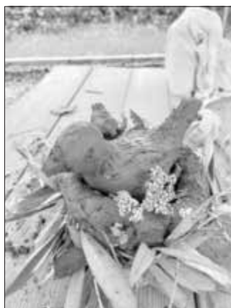
Der 200 Mio. Jahre alte Lehm lässt sich zu vielerlei Skulpturen gestalten.