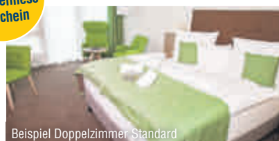
Beispiel Doppelzimmer Standard