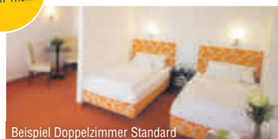
Beispiel Doppelzimmer Standard