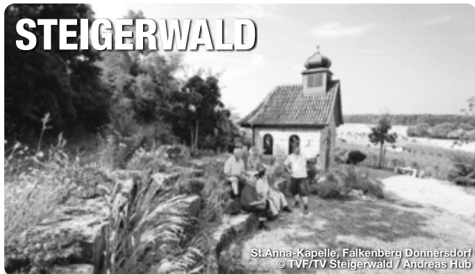
St. Anna-Kapelle, Falkenberg Donnersdorf

Alle Termine und Angaben unter Vorbehalt!