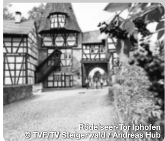
Rödelseer-Tor Iphofen

Der Steigerwald ist eine Region, die mit ihrer Vielfalt überrascht: Alte Wälder, sonnige Weinberge, historische Städtchen, male- rische Dörfer, Flüsse und Teiche, Höhen und Weite. Eine Natur, die anregt zum Haltmachen, zum Genießen, zum Erleben. Hier treffen Sie auf Buchenwälder, die in ihrer Art und Ursprünglich- keit einmalig in ganz Deutschland sind. Hier wird deutlich, was Kulturlandschaft bedeutet: Erbe, das bereichert, Gegenwart, die verzaubert. Zeit für die fränkische Vielfalt - landschaftlich, kulturell und nicht zuletzt kulinarisch bietet der Steigerwald eine einzigartige Vielfalt – ob im goldenen Herbst, in der Winterzeit bei traumhaften Weihnachtsmärkten oder beim Frühlingserwa- chen. TreffpunktDeutschland.de/steigerwald