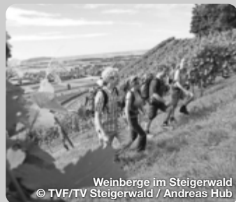
Weinberge im Steigerwald