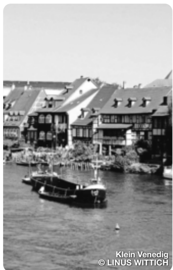
Klein Venedig

Bamberg Erleben Sie eine Stadt voller Geschichte und Kultur, im Mittelalter erschaffen und bis heute erhalten. Die Bamberger Altstadt gehört seit 1993 zum UNESCO Weltkulturerbe und begeistert mit ihren histori- schen Gassen und Plätzen, Kirchen und Bürgerhäusern aus Barock und Mittelalter.