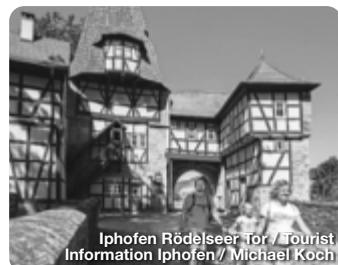
Iphofen Rödelseer Tor

Ein Rundgang durch das Fränkische Freilandmuseum ist wie eine Zeitreise durch 700 Jahre fränkische Alltags- geschichte: Über 100 Gebäu- de, Bauernhöfe, Handwerker- häuser, Mühlen, Schäfereien, Brauereien, Amtshaus, Schul- haus und Adelsschlösschen, Scheunen, Ställe, Back- und Dörrhäuschen laden ein zur Entdeckungsreise in die Ver- gangenheit. Sie vermitteln, wie die ländliche Bevölkerung in Franken früher gebaut, ge- wohnt und gearbeitet hat. Erkenbrechtallee 1, Bad Windsheim