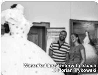
Wasserschloss Unterwittelsbach