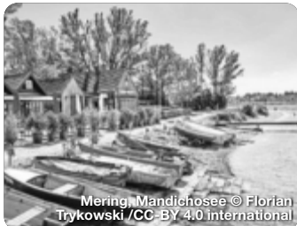
Mering, Mandichosee