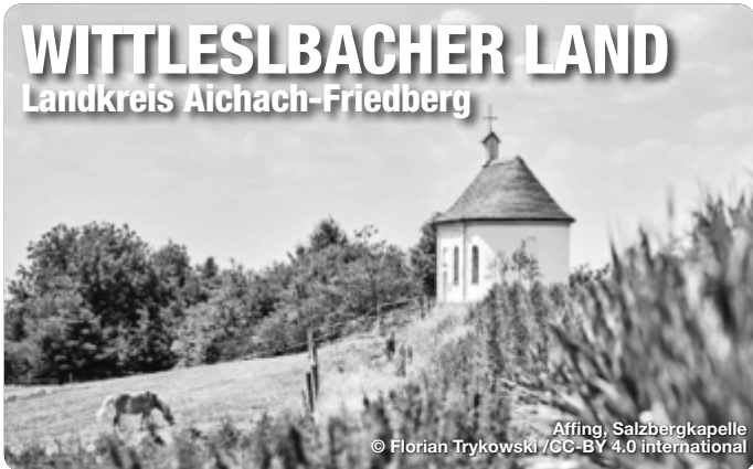
Affing, Salzbergkapelle

Alle Termine und Angaben unter Vorbehalt!