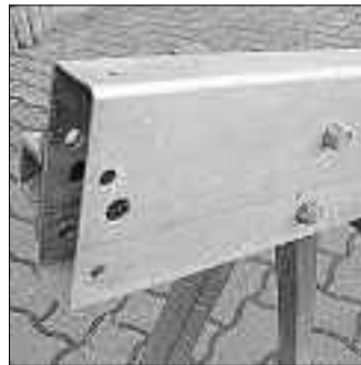
Neuen Fuß aufstecken ...