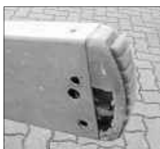
Neuen Fuß besorgen ...