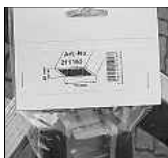
Alten Fuß entfernen