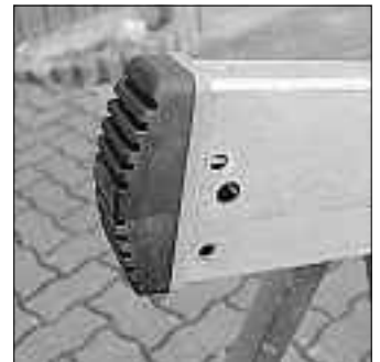
Verschrauben - fertig!