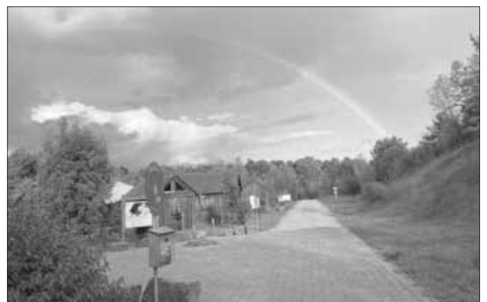
Förderverein Umweltstation Lias-Grube e.V.