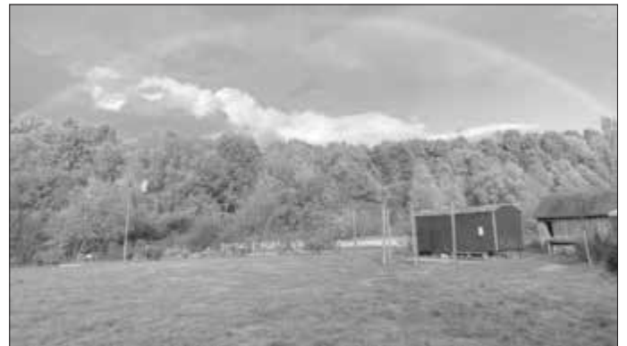
Förderverein Umweltstation Lias-Grube e.V.

Weiterhin heißt Sie die Umweltstation Lias-Grube auch zu den beliebten Veranstaltungen im Jahres- oder den Ferienprogrammen oder einem Kindergeburtstag willkommen. Zudem steht sie Ihnen auch dieses Jahr wieder als Ausflugsziel oder Übernachtungsort mit Ihrer Schulklasse oder Kindergruppe zur Verfügung. Die Räumlichkeiten und das Freigelände der Umweltstation bieten einen wunderschönen Rahmen für Ihren Betriebsausfluges, Ihre Tagung, Fortbildung oder private Feier. Ausführliche Informationen zum Angebot und den Projekten finden Sie auf der Webseite www.umweltstation-liasgrube.de oder unter der Telefonnummer 09545 950399.