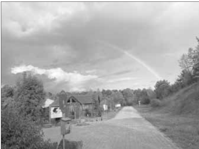
Förderverein Umweltstation Lias-Grube e.V.