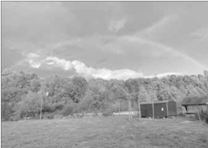
Förderverein Umweltstation Lias-Grube e.V.

Ausführliche Informationen zum Angebot und den Projekten finden Sie auf der Webseite www.umweltstation-liasgrube.de oder unter der Telefonnummer 09545 950399.