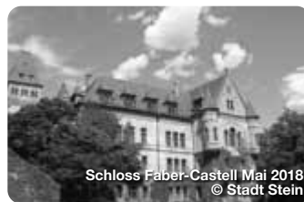
Schloss Faber-Castell Mai 2018

Ehem. Augustiner Chorherrenstift Das Kloster wurde 1409 von den Burggrafen von Nürnberg Johann III. und Friedrich VI. gestiftet. Zerstörung im Jahre 1460. Wiederaufbau bis 1468. Prinzregentenplatz 2, Langenzenn