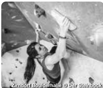
Zirndorf Boulderhalle

Naturlandschaft und Stadtfair – Landkreis Fürth entdecken. Im fränkischen Landkreis Fürth, beim Städtedreieck Nürnberg, Fürth und Erlangen gelegen, gibt es viele Erlebnisse zu entdecken. Auf den zahlreichen Rad- und Wanderwegen durch das bezaubernde Biberttal oder den verträumten Zenngrund lässt sich der Landkreis entdecken. Bei Schlechtwetter können sich Besucherinnen und Besucher den Indoor-Aktivitäten zuwenden. Genieß den Tag mit einem Spaziergang durch die historischen Räume des Faber-Castell Schlosses, mit Erholung in der Palm Beach Saunawelt oder mit einem Abend in den urigen Restaurants der Region. TreffpunktDeutschland.de/fuerth-landkreis