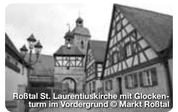
Roßtal St. Laurentiuskirche mit Glockenturm im Vordergrund

Wer an Stein denkt, dem fällt wohl zuerst Faber-Castell ein oder die B14 oder beides. Dabei hat die Stadt, die zwar am südwestlichen Rand Nürnbergs am linken Ufer der Rednitz liegt, aber zum Landkreis Fürth gehört, viel, viel mehr zu bieten. TreffpunktDeutschland.de/rosstal