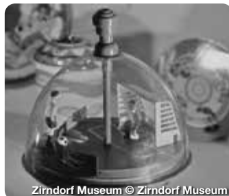
Zirndorf Museum