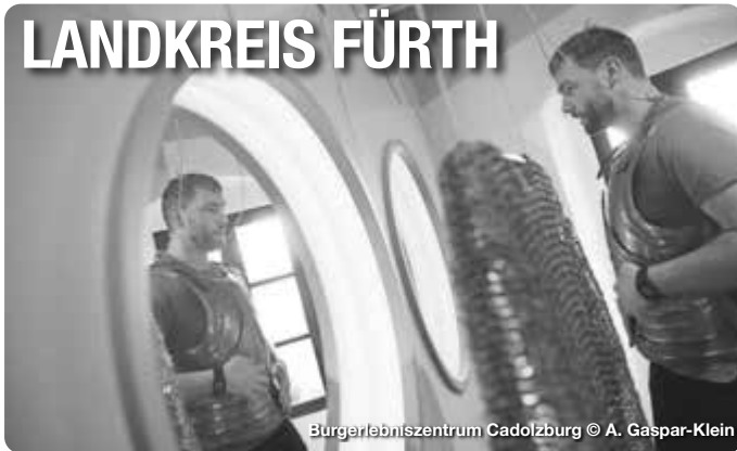
Bürgerlebenszentrum Cadolzburg

Alle Termine und Angaben unter Vorbehalt!